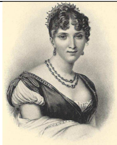
Juliette Récamier (1777-1849)

Nous serions bien moins étonnés de souffrir, si nous savions combien la douleur est plus adaptée à notre nature que le plaisir. L'homme à qui tout succède selon ses vœux oublie de vivre. La douleur seule compte dans la vie, et il n'y a rien de réel que les larmes. 34